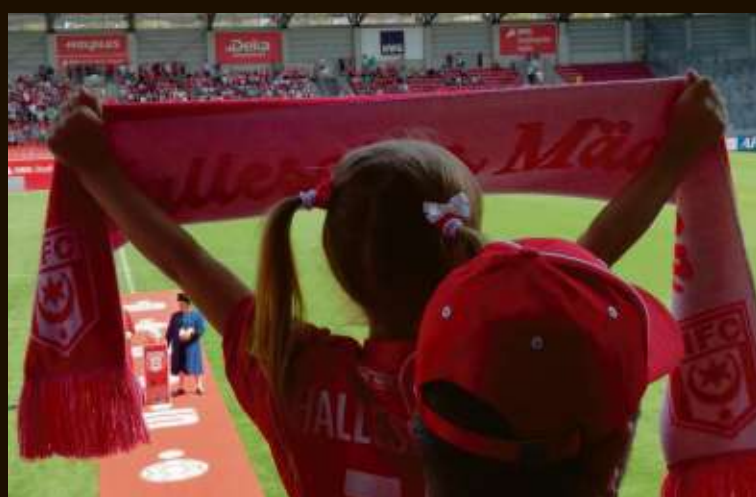
Endlich geht es wieder los! Die Fans der HFC fiebern dem Saison-Auftaktspiel am 4. August gegen Rot-Weiß Essen entgegen.

jetzt auch für die Hallenser zum Auftakt in die neue Saison trifft.