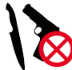
WAFFEN VERSCHIEDENER ART

ES GELTEN DIE HAUS- UND STADIONVERORDNUNG DES SC FREIBURG UND DIE POLIZEIVERORDNUNG DER STADT FREIBURG IM BREISGAU.