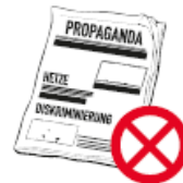
RASSISTISCHES, FREMDEN-FEINDLICHES, EXTREMISTISCHES ODER POLITISCHES PROPAGANDAMATERIAL