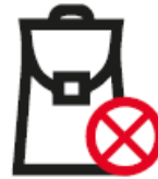
TASCHEN UND RUCKSÄCKE (größer als ein DIN A3 Format)