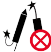
FEUERWERKSKÖRPER, LEUCHTKUGELN, RAUCHPULVER, RAUCHBOMBEN (pyrotechnische Gegenstände)