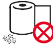
PAPIERROLLEN UND KONFETTI