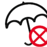
STOCKSCHIRME MIT HOLZ- ODER METALLSPITZE