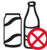
GLASBEHÄLTER, ALKOHOLISCHE GETRÄNKE, FLASCHEN, DOSEN