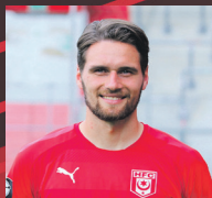
33 JONAS NIETFELD