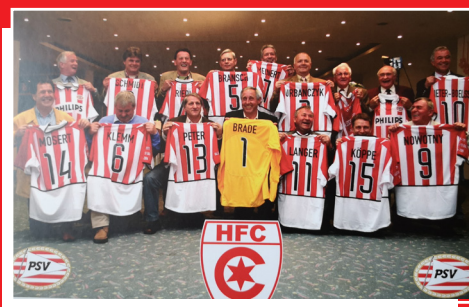
Die 1971er Mannschaft des HFC zeigt ihre Trikots, die PSV-Trainer Guus Hiddink im Jahre 2006 zum symbolischen Europapokal-Rückspiel nach Halle mitgebracht hatte.

Im 40. Jahr der Gründung des HFC standen die Zeichen günstig, dieses Vorhaben endlich in Angriff zu nehmen. Der PSV Eindhoven wollte 2006 zwischen Saisonende und dem Pokalfinale gegen Ajax Amsterdam am 7. Mai noch ein Testspiel absolvieren. Und darin sahen die Hallenser eine günstige Gelegenheit, das 1971 abgesagte Europapokalspiel nachzuholen. Also machte sich ein paar Wochen vor dem möglichen Termin eine kleine Abordnung aus Halle mit dem eigenen fahrbaren Untersatz auf in die holländische Stadt, in der auch der Welt-