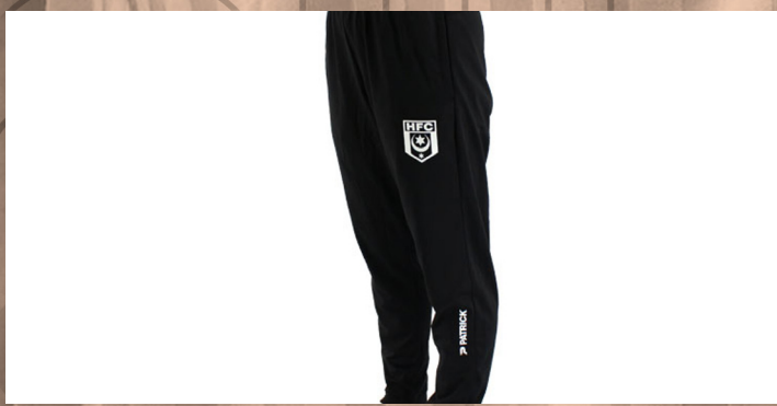
Trainingshose 3XS bis XXL | 20 €