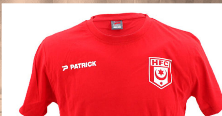
Trainingsshirt 3XS bis XXL | 10 €