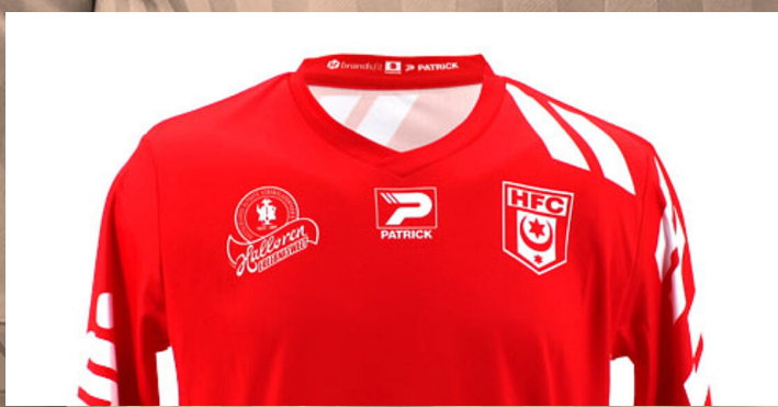
Präsentationsshirt 4XS bis 6XL | 30 €