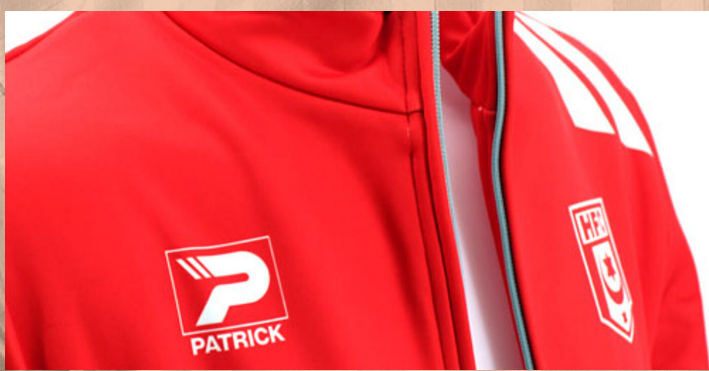
Präsentationsjacke 4XS bis 6XL | 50 €