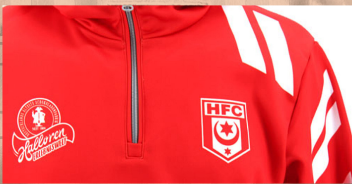
Präsentations-Hoodie 4XS bis 6XL | 45 €