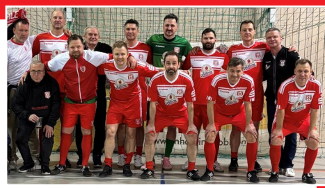
Beim Benefiz-Hallenturnier in Bitterfeld-Wolfen ist die HFC-Traditionself bis ins Finale vorgedrungen. Nun geht es in die Freiluft-Saison.

Im August läuft die HFC-Traditionself bei der SG Jessnitz und dem SV Hohenmölsen auf. Aus dieser Kleinstadt im Süden von Sachsen-Anhalt stammt unter anderem Uwe Machold. Der „Pfeil von Hohenmölsen“, wie ihn die Fans wegen seiner Schnelligkeit nannten, absolvierte von 1984 bis 1992 insgesamt 197 Spiele für den HFC, darunter fast 100 in der DDR-Oberliga. Zehn Partien bestritt er 1991/92 in der 2. Bundesliga. Der 1,80 Meter große und 73 Kilo schwere Flügelstürmer erzielte insgesamt 41 Treffer für die Rot-Weißen. Im Sommer 1992 ist der frühere HFC-Torjäger nach Biberach in Oberschwaben gegangen, um dort seine Karriere zu beenden. In den zurückliegenden Jahren ist „Ede“ Machold immer mal wieder im Halleschen Stadion gewesen, um sich Spiele seiner Nachfolger beim HFC anzuschauen.