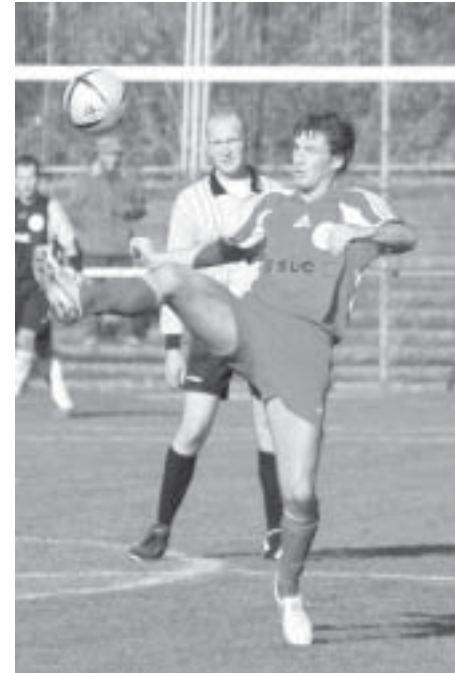
Gegen den TSV Völkpe bestritt er in der Verbandsliga-reserve sein erstes Punktspiel in dieser Saison.

„Zizu“ spielt seine dritte Saison im HFC-Oberligateam. In 42 Spielen kam er zum Einsatz und erzielte dabei 3 Tore.