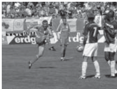
Fotos J.P. Flato aus: Oberligaspiel HFC - 1. FCM 2:0 vom 4.9.2004, die Torschützen L. Georg u. H. Krauß