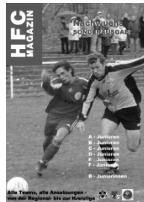
Alle Teams, alle Ansetzungen - von der Regional- bis zur Kreisliga Das HFC-Nachwuchsmagazin ist erschienen. Wer es noch nicht hat: An der Stadionkasse und im WOSZ Fan-Shop ist es erhältlich. Natürlich auch zu jedem Heimspiel und auf dem Sandanger.