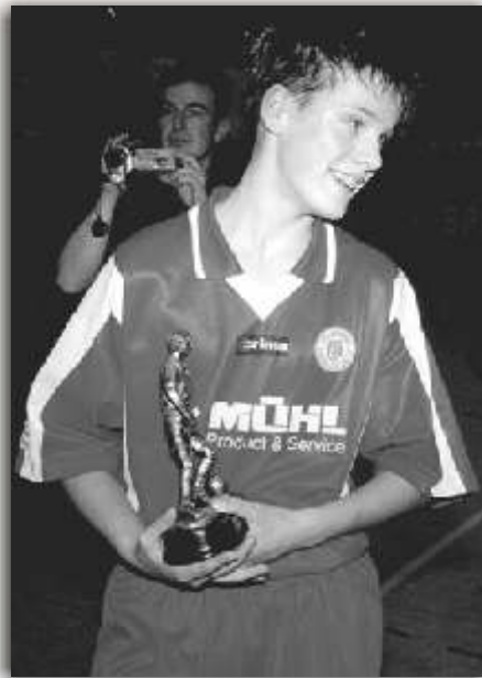
C. Schorch beim "Opel-Mundt-Cup 2002" - Bester Spieler

Natürlich kämpft die Mannschaft um Platz 1 in der Verbandsliga. Aber die Entwicklung von Führungsspielern für die nächsten Jahre ist vordergründig!