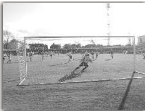
Unten: Rafal Klajnszmit verwandelt gegen Mewes

Clubcasino Waisenhausring 3 · 06108 Halle Öffnungszeiten: Montag: Ruhetag Di. - Do.: 17.00 - 24.00 Uhr Freitag: 17.00 - 01.00 Uhr Samstag: 14.00 - 01.00 Uhr Sonntag: 14.00 - 21.00 Uhr Sonderveranstaltungen sind nach Absprache möglich.