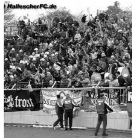
Polizeieinsatz gegen HFC-Fans.