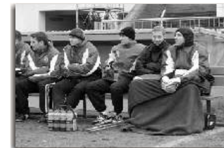
Am Ende stand die Enttäuschung ins Gesicht geschrieben.

Einen Sieg, den die phantastischen HFC-Fans - und nicht nur die - eigentlich vom HFC erwartet hatten.