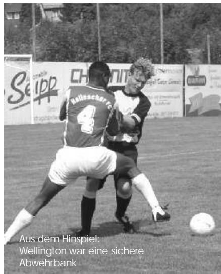
Aus dem Hinspiel: Wellington war eine sichere Abwehrbank

um die schmerzlichen Lücken zu schließen. Die Bilanz der Begegnungen gegen den HFC in der 4. Liga ist so hoffnungslos nicht. Für beide Teams stehen je 4 Siege und ein Unentschieden bei einem Torverhältnis von 11:11 zu Buche. Im KWS verloren die Chemnitzer erst einmal (1997/98: 2:5). Im vergangenen Jahr gab es ein 0:0 in Halle und einen 1:0-Erfolg für den VfB in Chemnitz. So ist das Motto der VfB-Homepage: "Die Unabsteigbaren bleiben die Unabsteigbaren" auch in Halle nicht ohne neue Hoffnungen, auch wenn der VfB im Hinspiel (3:0 für den HFC) ohne Chance war.