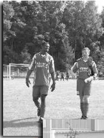
Glücklicher Abgang von zwei Ex-96-ern in Hettstedt