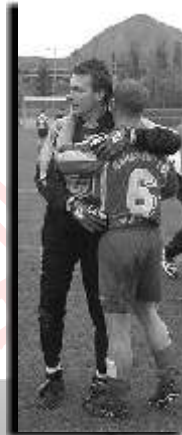
Sturmtrio in Nebra