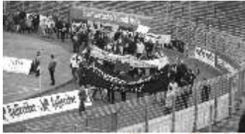
HFC und Ammendorf müssen weiter leben