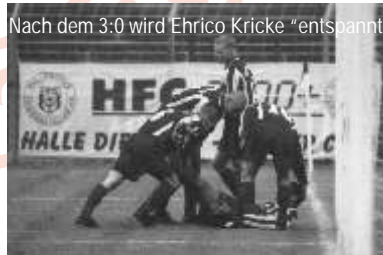
Nach dem 3:0 wird Ehrico Kricke "entspannt"