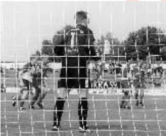
Die HFC-Abwehr sah zweimal nicht gut aus.